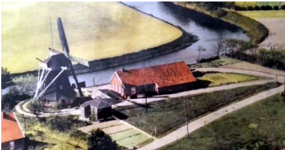
Mühle u. Elternhaus Ülkegatt in Altfunnixiel, wo ich von 1964-68 lebte

ich bin außerordentlich erfreut mitteilen zu können, dass ich das begehrte „artist in residence“-Stipendium Künstlerhaus Hooksiel erhalten habe. Unter zahlreichen Bewerbern ist mir ein Arbeitsaufenthalt zugesprochen worden. Vom 1. September bis zum 14. Oktober 2018 werde ich dann im Künstlerhaus Hooksiel (bei Wilhelmshaven/Nordsee) leben, arbeiten, Workshops geben und meine Werke im Rahmen einer Ausstellung zeigen. Für mich (in Wittmund/Ostfriesland geboren, erste vier Kindheitsjahre in einer alten Windmühle in Altfunnixiel, später Kindheit und Jugend im Oldenburger Raum, viele Sommerferien an der ostfriesischen Küste) ist dieses anerkennende Echo aus der alten Heimat von besonderer Bedeutung. Unterstützt wird diese Künstlerförderung von der OLDENBURGISCHEN LANDSCHAFT (KdÖR), und dem Land Niedersachsen.