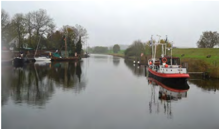
Hafen Hooksiel

Die künstlerischen Ergebnisse meines Arbeitsaufenthaltes werden dann zur Finissage ausgestellt sein.