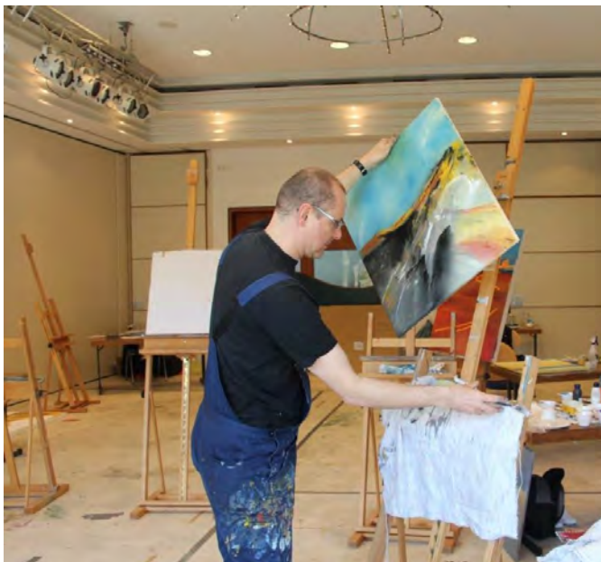
Workshops mit experimentellen Techniken

Info-PDFs zu diesen Kursen unter: http://www.hinrich-schueler.com/workshops.html