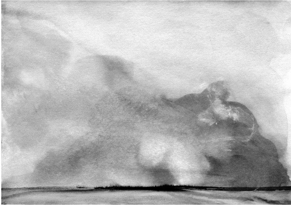
H. Schüler, „Nordische Landschaftsskizze (2016)“, Mischtechnik/Papier, 10 cm x 18 cm