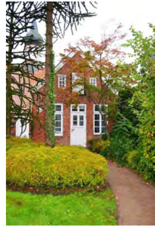
das Atelier

Während meines Aufenthaltes im Künstlerhaus werde ich im dortigen Atelier zwei Workshops veranstalten: