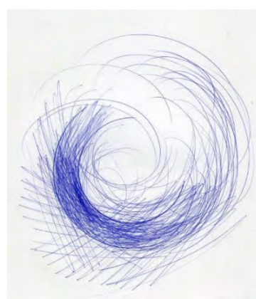
Kompositionen: Hinrich JW Schüler