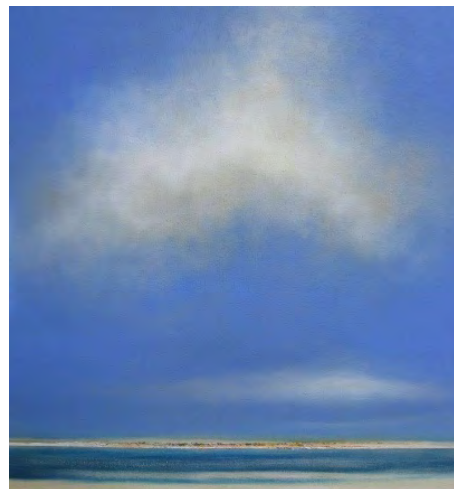
Hinrich JW Schüler: Seestücke mit Wolke