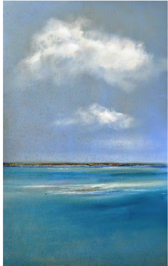
Hinrich JW Schüler: Seestücke mit Wolken

Wolken prägen den Charakter einer gemalten Landschaft und sind ein sehr gutes und wichtiges Gestaltungsmittel, welches der Maler beherrschen sollte. Der Kurs ist für Einsteiger und Fortgeschrittene gleichermaßen geeignet.