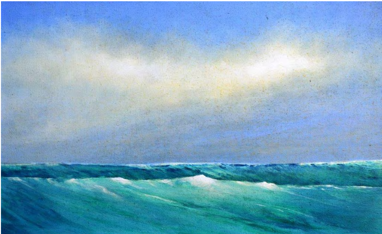
Hinrich JW Schüler: Seestück mit Wolke

Die malerische Beschäftigung mit den Themen Wasser, Wolken und Wind ist eine wunderbare Aufgabe. Wie können wir diese bewegten, fließenden, wandelbaren und durchlichteten Elemente malerisch überzeugend darstellen? Wir arbeiten in diesem Kurs mit altmeisterlichen Lasurschichttechniken ebenso wie mit informellen Experimenten. Beides ist wichtig, um einen individuellen und originellen bildnerischen Ausdruck zu erreichen zwischen Realismus und Abstraktion. Hinrich Schüler vermittelt den richtigen Umgang mit den Phänomenen Farbe, Helligkeit, Beleuchtung und Licht, die zur Formfindung dienen. Über Komposition und die Erschaffung von Räumlichkeit auf und aus der Fläche wird in Kurzvorträgen referiert.