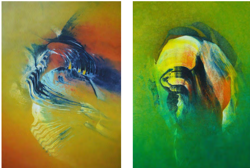
Hinrich JW Schüler; Aquasphere-Bilder

In diesem Kurs malen wir frei-improvisierend und spontan, ohne blockierende Vorlagen, Vorstellungen, Absichten. Wir sehen, was Freie Malerei an wunderbaren Erfahrungen schenkt: ausdrucksstarke und persönliche Bilder mit eigener Stilistik. Aus Arbeitsschritten und Farbschichten wird Ge-Schichte, Entstehungsprozesse werden zum Bestandteil des Werkes. Malerei ist hier eine Entdeckungsreise, bei der die klassischen Acrylmaltechniken durch Experimente und spontane Ideen gestalterisch erweitert werden: Formen entwickeln sich aus dem Spiel der Farben. Und aus Flächen, Linien, Strukturen auf der Fläche entfaltet sich Räumlichkeit. Hinrich Schüler unterstützt dabei unsere Arbeit korrigierend und mit Kurzvorträgen zu Komposition und Farbenlehre.