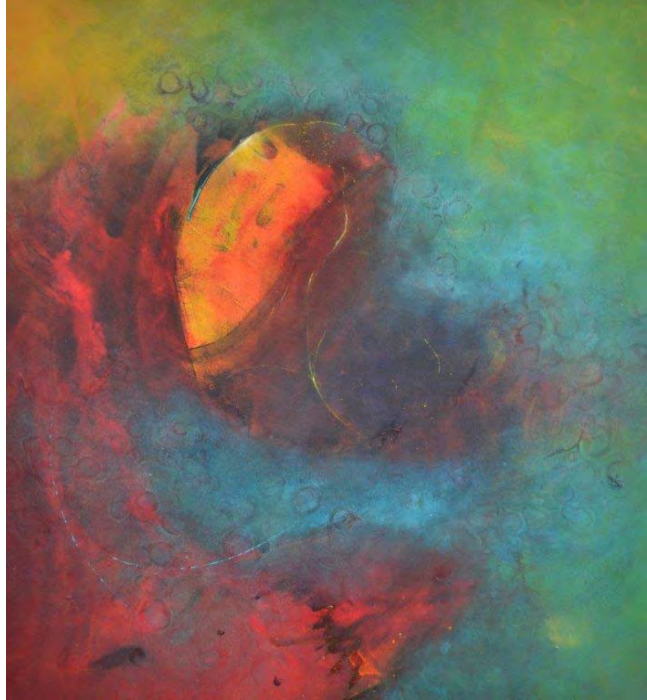
Hinrich JW Schüler: Aquasphere-Bilder