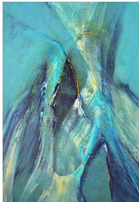
Hinrich JW Schüler: Aquasphere-Bilder