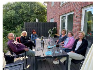
Atelier und Kursleben