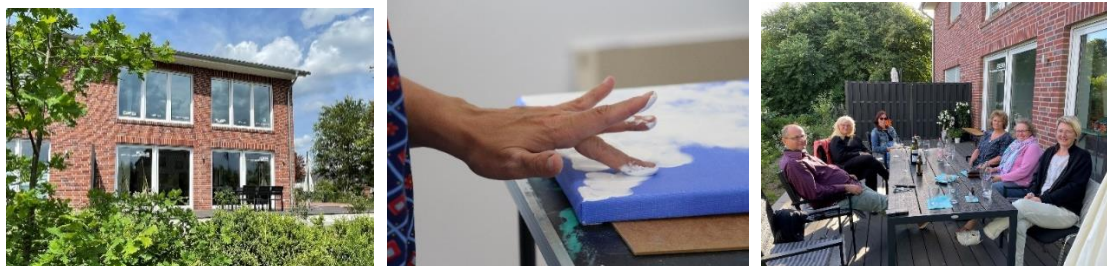
Atelier und Kursleben

Nahezu alle „Lokalitäten“ wie z.B. Restaurants, Cafés, Supermärkte sind vom Atelierhaus aus fußläufig zu erreichen. Ebenso schnell ist man im Grünen, um in die einzigartige Natur der Lüneburger Heide oder des Pietzmoores einzutauchen, die Ruhe zu genießen und neue Inspirationen zu sammeln. Anne gibt Dir gerne persönliche Tipps und Empfehlungen.