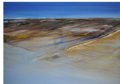
„Hinrich JW Schüler – Der Klang der Weite“ – neue Landschaften, Acryl auf Baumwolltuch, 50 cm x 70 cm